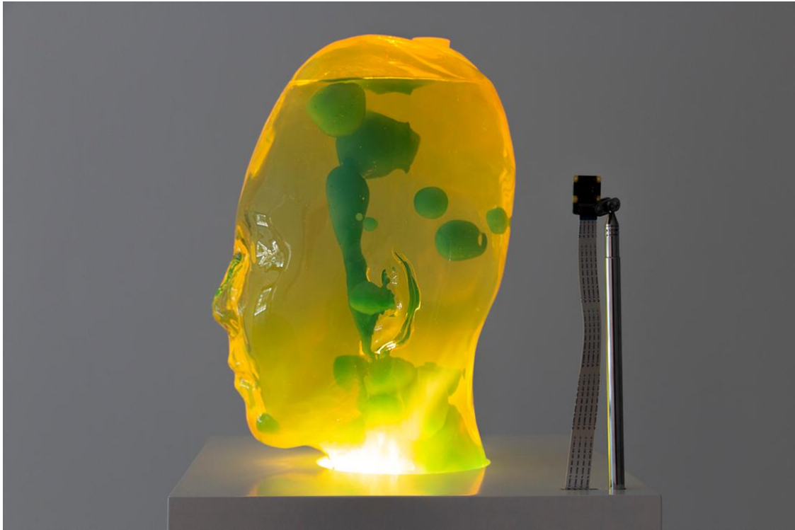
Yksityiskohta teoksesta I Magma (2019).