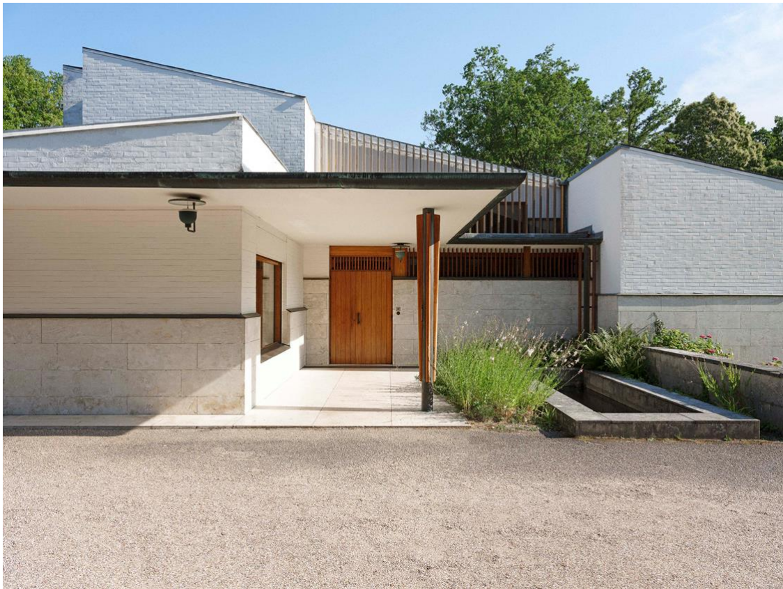
Maison Louis Carré.