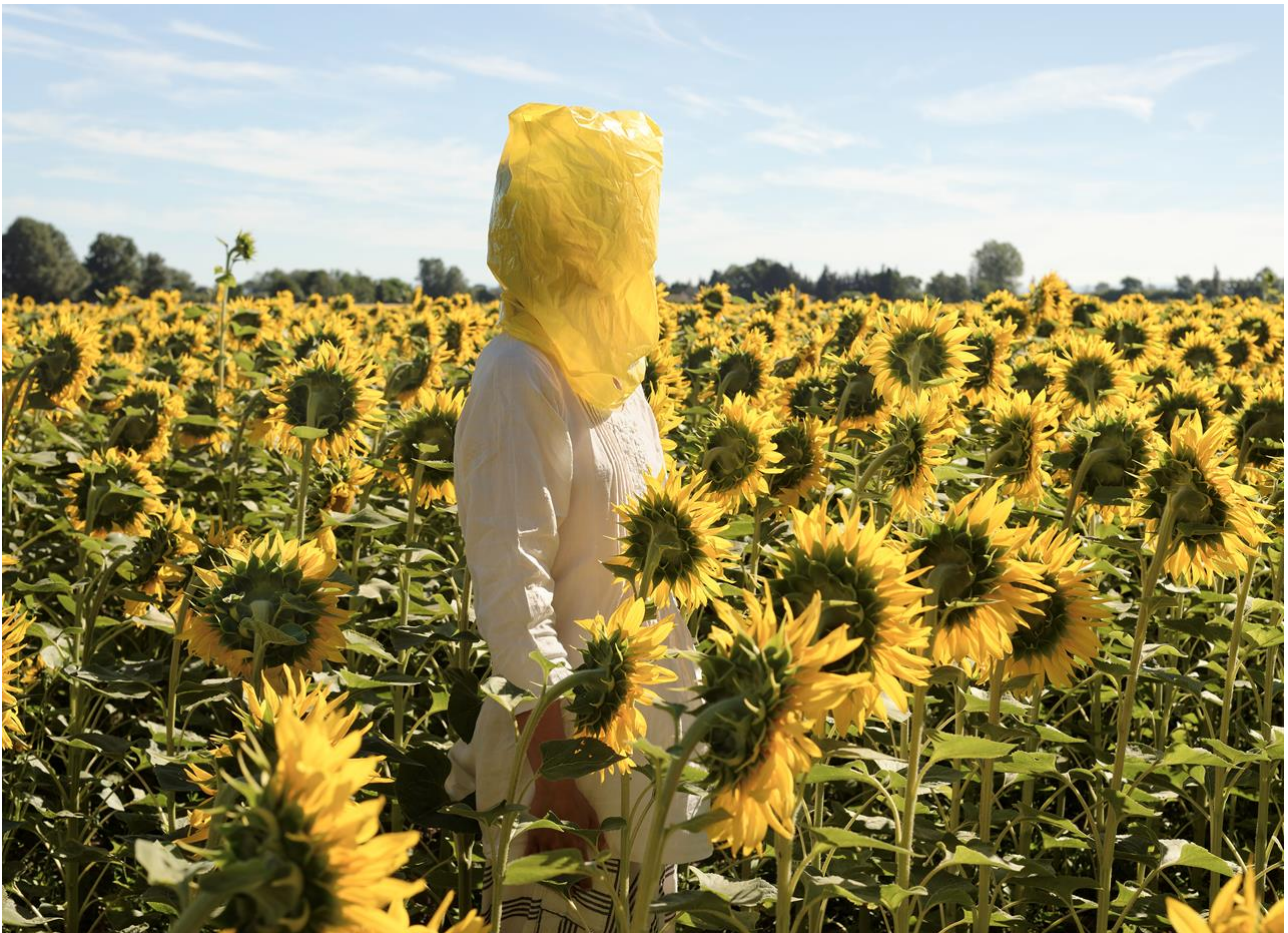
Portrait Series (Gelbe Musik with Sunflowers), 2016, from the series The Baldessari Assignments, Art'Us Collectors' Collective, © VG Bild-Kunst, Bonn 2020