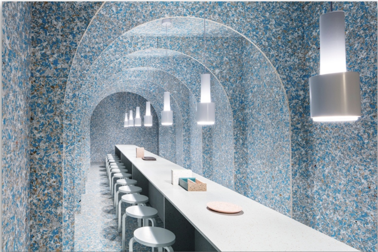
Zero Waste Bistro.

Suomen kulttuuri- ja tiedeinstituutit Finlands kultur- och vetenskapsinstitut The Finnish Cultural and Academic Institutes