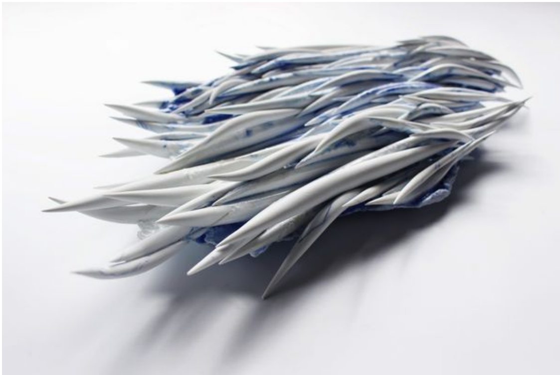
Kuva: Yuri Fukuoka: Blue Journey, 2019