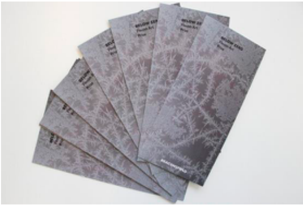
Kuva: Aino-Sofia Niklas-Salminen