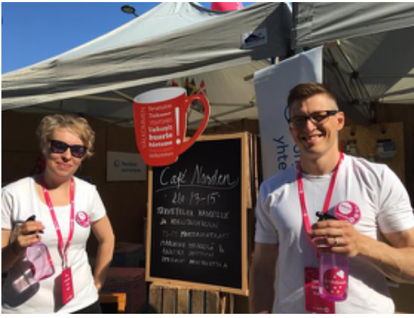
Kuva © Hanaholmen

Hanasaaren ruotsalais-suomalainen kulttuurikeskus