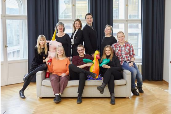
Suomen Saksan-instituutin tiimi tammikuussa 2020.