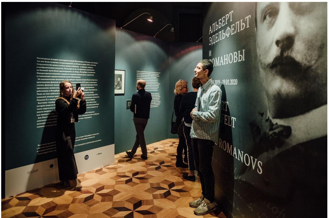
Albert Edelfelt ja Romanovit -näyttely oli marraskuusta tammikuuhun esillä Pietarissa.